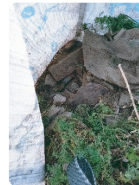
Autres déchets : terre, briques, gravats, ...