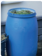
Contenant sans poignée