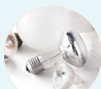
Ampoules / néons